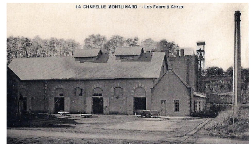
Les trois halles d'extinction, surmontées de lanterneaux, en avant des fours et du monte-charge.

Les bâtiments de la chaudière et de la machine à vapeur ont disparu ou sont méconnaissables. Les murs d'une halle d'extinction de la chaux vive ont été conservés lors de la réfection du toit.