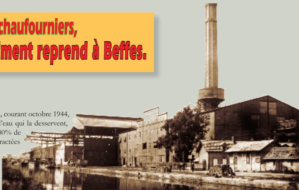
Beffes : la grande usine vers 1950

Ces obstacles « techniques » à la reprise d'une pleine production pouvant être facilement surmontés, il en reste un, des plus pernicieux : l'ORPI ne délivre pas les nécessaires bons de déblocage du ciment pour les entreprises qui en ont besoin. Aussi la production, même réduite, s'entasse-t-elle à l'usine qui est menacée d'asphyxie et d'arrêt alors que, par exemple, les mille ouvriers qui construisent le barrage de l'Aigle (département de la Corrèze sur la Dordogne) attendent, et qu'un camion venant chercher du ciment pour remettre en état les ponts de la Charité sur Loire est reparti à vide.