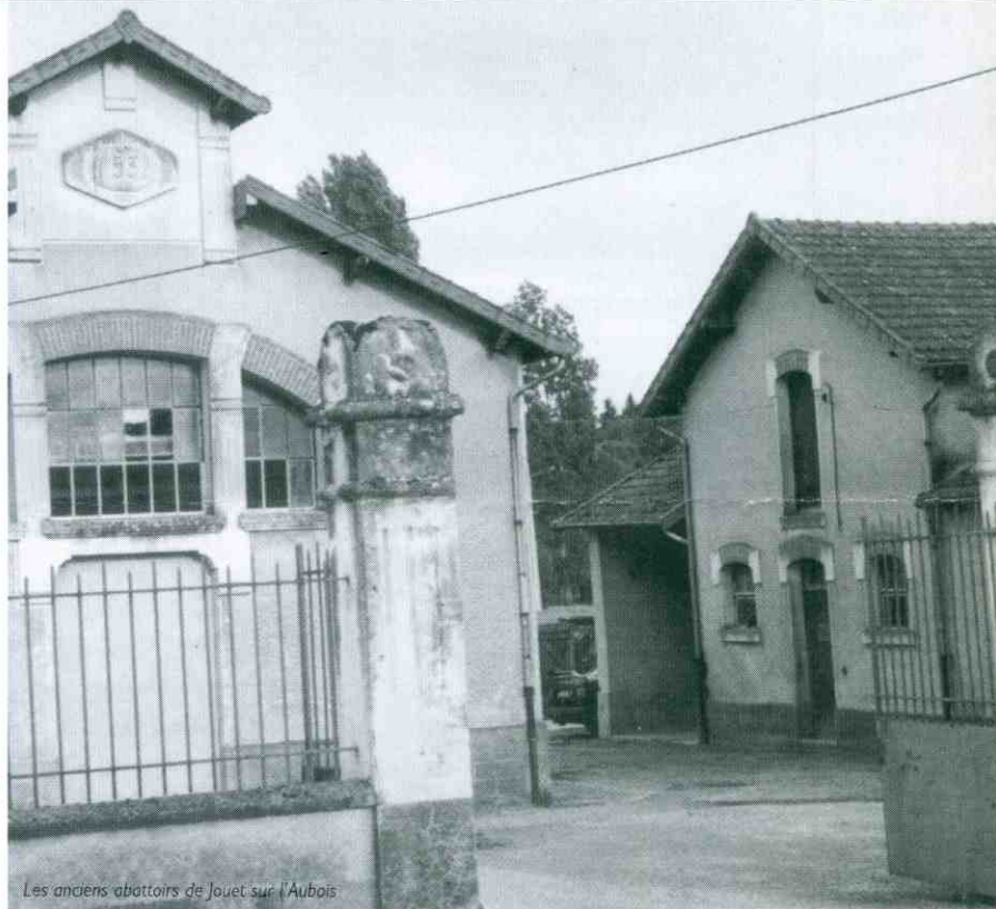
Les anciens abattoirs de Jouet sur l'Aubois

Autre signe encourageant, la présence du Conseil Général du Cher au salon du patrimoine culturel au Carrousel du Louvre à Paris, du 8 au 11 novembre dernier. Le thème de cette année en était le patrimoine militaire. La présentation des actes du colloque international des 2 et 3 mars 2001 de Saint Amand Montrond - forteresse oblige - relatifs aux projets et dessins d'ingénieurs militaires en Europe du XVI ème au XIX ème siècle, organisé par les Archives Départementales du Cher, ont permis d'expliquer les actions de valorisation touristique mise en œuvre avec la politique des pôles de développement proposée par le Conseil Général.