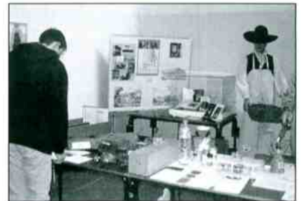
Un de nos stands ATF

Elles ont obtenu sur les sites le succès escompté. Elles répondent à une curiosité légitime des habitants du pays Loire-Val d'Aubois qui s'y font "touristes" d'un canton à l'autre et elles procurent le plaisir d'accueillir des voisins du Cher, de la Nièvre et de plus loin.