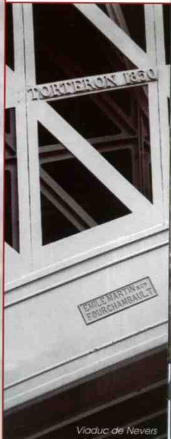
Viaduc de Nevers

■ Cinq sites liés à la métallurgie ( forges, digues, logements ) édifiés entre 1788 et 1932 sont visitables. Tél : 04 70 66 63 72