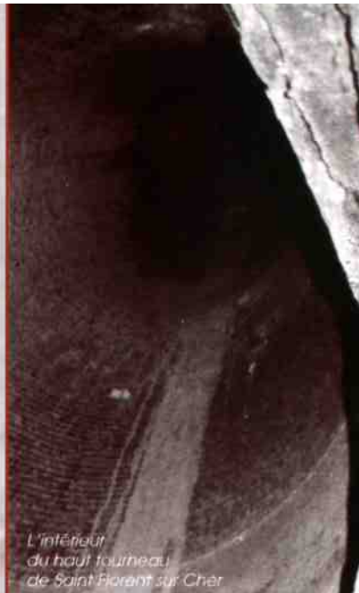
L'intérieur du haut fourneau de Saint-Florent sur Cher

■ Sur la route de Saint-Germain, à 200 m du croisement de la route de Marseilles, l' usine des Chavants ( ou Chats-Huants ) présente six fours à chaux en pierre avec leur encadrement de brique. Les murs de la halle de séchage sont aérés - ce qui est rare - par des creux décoratifs. Franchir la D26 (Jouet-Marseilles) et aller vers les restes de l' usine du Pont des Taureaux , en contrebas de sa carrière de calcaire et près du canal de Berry ( comblé ).